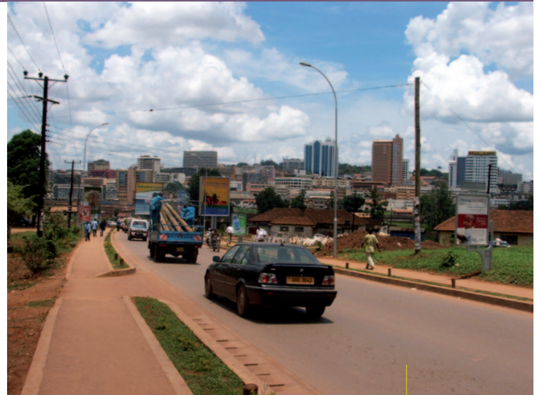
Uganda, Kampala, 2006 rok. Stolicę Ugandy Kampalę zamieszkuje ponad milion mieszkańców. Jest ona jednym z najszybciej rozwijających się miast w Afryce. Ciekawa architektura miasta to mieszanka stylu kolonialnego, wpływów indyjskich oraz nowoczesnych drapaczy chmur i szklanych wieżowców. Kampala to nie tylko prężnie rozwijające się centrum handlu i biznesu, lecz także ważny ośrodek kultury i sztuki.

Nie należy traktować jako źródła wiedzy o krajach Południa publikacji, które przedstawiają nieaktualne informacje i opinie. Wyrazistym przykładem może być powieść „W pustyni i w puszczy”, która w ciągu wieku od jej napisania zachowała wartość artystyczną, lecz całkowicie przestała być wiarygodnym źródłem wiedzy o Afryce. Omawiając z młodzieżą powieść Sienkiewicza, nie można więc przejść do porządku dziennego nad sposobem obrazowania Afryki i jej mieszkańców przez wielkiego polskiego pisarza. Należy przypomnieć uczniom i uczennicom, że przed wiekiem popularne były opinie, które obecnie uważane są powszechnie za niedopuszczalne. Pomocą w takiej dyskusji z młodzieżą mogą być specjalistyczne scenariusze lekcji, np. scenariusz dla klas 5 szkoły podstawowej z wykorzystaniem lektury „W pustyni i w puszczy” nt. podejścia do ludzi z globalnego Południa, scenariusz dla klas 6 szkoły podstawowej z wykorzystaniem lektury „Przygody Tomka Sawyera” nt. podejścia do ludzi z globalnego Południa.