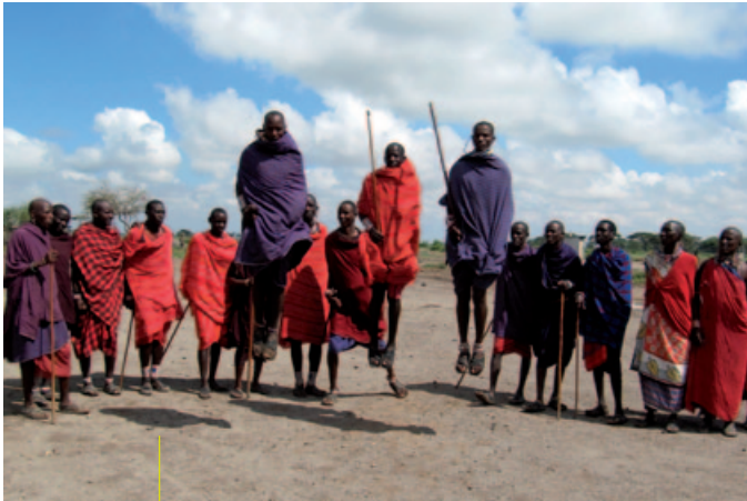
Park Narodowy Amboseli, Kenia, taniec Masajów. Creative Commons, na warunkach licencji GNU Frez Documentation License. Fot. Daryona

Ograniczona liczba informacji o krajach globalnego Południa docierających do szerokiej publiczności często skutkuje tym, że pojedynczy obraz czy historia mogą rzutować na wizerunek całej społeczności lub populacji. I tak zdjęcie wojowników masajskich może stwarzać błędne wyobrażenie, że wszyscy Tanzańczycy czy w ogóle Afrykańczycy chodzą na co dzień w tradycyjnych strojach, z dzidami w rękach. Analogicznie: pokazanie Polaków w strojach ludowych, np. kaszubskich, nie odzwierciedla przecież wyglądu przeciętnego mieszkańca czy mieszkanki Polski. Mówiąc o zdarzeniach dramatycznych, takich jak wojny czy głód, warto pokazywać je w sposób możliwie obiektywny, bez wybielania rzeczywistości czy przesadzania. Ukazywanie problemów, z których my – ludzie z krajów wysoko rozwiniętych – na co dzień nie zdajemy sobie sprawy, jest wyrazem solidarności z tymi, których one dotyczą. Niezbędne jest