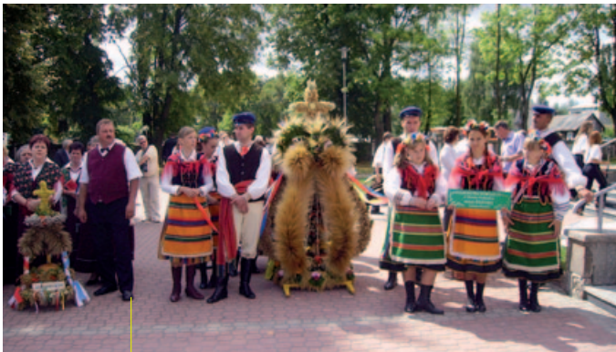
Mońki 2011, Dożynki wojewódzkie, wieniec z Patoki (gm. Brańsk). Creative Commons, na warunkach licencji GNU Frez Documentation License. Fot. Henryk Borawski

Warto również pamiętać, że niektóre tematy są niezmiernie delikatne i dokumentowanie ich wymaga szczególnej wrażliwości. Publikując materiały dotyczące osób zarażonych wirusem HIV, o innej orientacji seksualnej, ofiar konfliktów czy przemocy, możemy narazić je na niebezpieczeństwo lub wykluczenie ze społeczności.