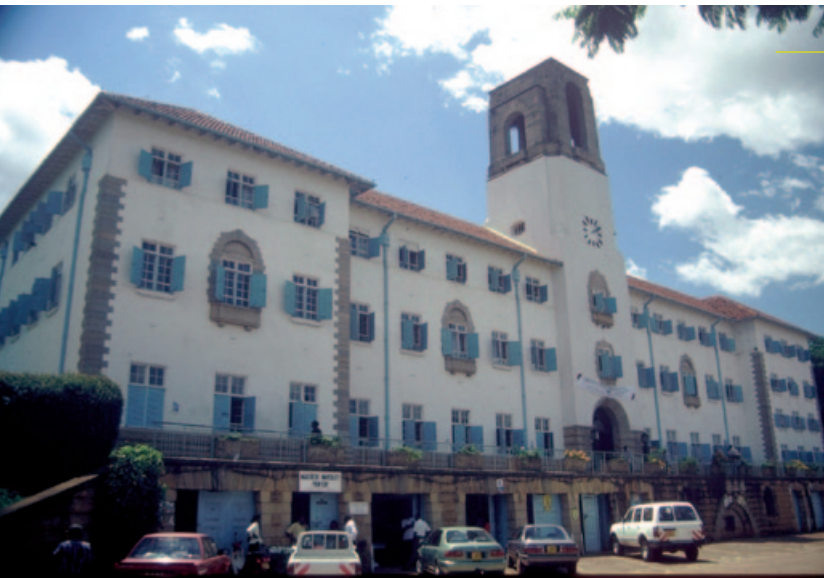
Uganda, Kampala, Makerere University. Creative Commons, na warunkach licencji Attribution ShareAlike Fot. Gunnar Ries

Czy wiesz, że... Uniwersytet Makerere powstał w 1922 roku i jest najbardziej znanym uniwersytetem we wschodniej i centralnej Afryce? Corocznie rozpoczyna w nim studia około 20 000 studentów. Często nazywany jest Oxfordem Afryki, kształci przyszłych lekarzy, informatyków i elity polityczne.