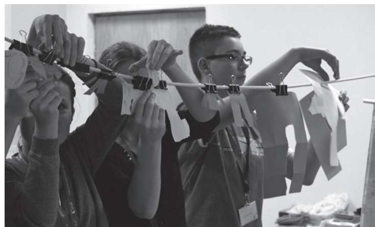
Szkolenie dla Szkół Humanitarnych, Konstancin-Jeziorna