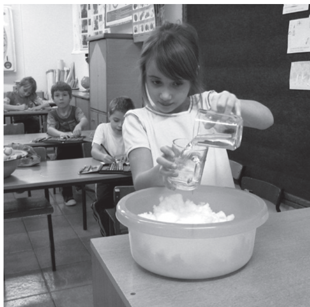
Publiczna Szkoła w Januszkowicach, realizacja projektu wodnego w szkole, fot.: Bernadeta Smolińska

W ramach projektu podjęto szereg działań mających na celu przybliżenie uczniom oraz społeczności lokalnej skali problemów wynikających z braku dostępu do wody pitnej oraz zagrożeń wynikających z pozbawionych refleksji i wiedzy sposobów korzystania z zasobów czystej wody. Uczniowie należący do Klubu Humanitarnego oraz cała społeczność szkolna zrealizowali zadania zaplanowane w projekcie. Poza zajęciami lekcyjnymi, których osnową stał się problem wody, uczniowie przygotowali wystawę plakatów, prezentacje multimedialne, przeprowadzili imprezę pod tytułem „Wodne eksperymenty – złoto jest niebieskie...”. Po obliczeniu ilości zużytej wody w gospodarstwach domowych oraz w szkole ogłosili akcję „Oszczędzamy wodę”. Aby poznać inny wymiar korzyści wynikających z siły daru natury, jakim jest woda, wybrali się na wycieczkę do Elektrowni Wodnej w Januszkowicach na Odrze. A na koniec wydali gazetkę poświęconą zadaniom realizowanym w ramach projektu.