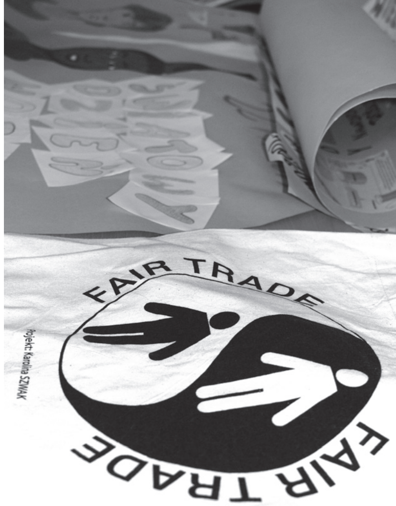
Spotkanie podsumowujące dla Szkół Humanitarnych, Kraków 2011, fot.: Katarzyna Mertuszka/PAH