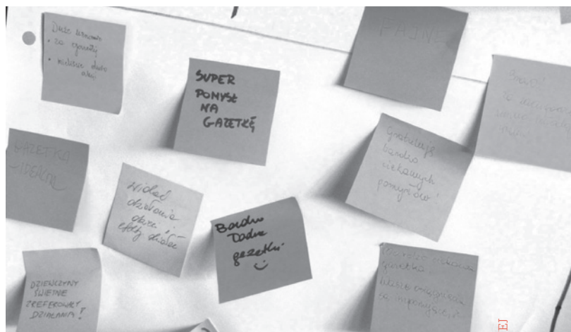
Spotkanie podsumowujące dla Szkół Humanitarnych, Warszawa

Wymienione powyżej założenia, dotyczące projektu gimnazjalnego powinny być również stosowane na innych etapach edukacji np. w szkole ponadgimnazjalnej, szczególnie, że w przypadku wielu przedmiotów taki wymóg istnieje. Zgodnie z podstawą programową wychowania przedszkolnego oraz kształcenia ogólnego w poszczególnych typach szkół z 2008 r., nauczyciel wiedzy o społeczeństwie jest zobligowany do tego, aby na III etapie edukacji, czyli w gimnazjum, co najmniej 20% treści nauczania zrealizować w formie uczniowskiego projektu edukacyjnego, a na IV etapie (szkoła ponadgimnazjalna) co najmniej 10%. 8 Ponadto, cele kształcenia ogólnego na III i IV etapie edukacyjnym, czyli w gimnazjum i szkole ponadgimnazjalnej również odwołują się do metody projektu.