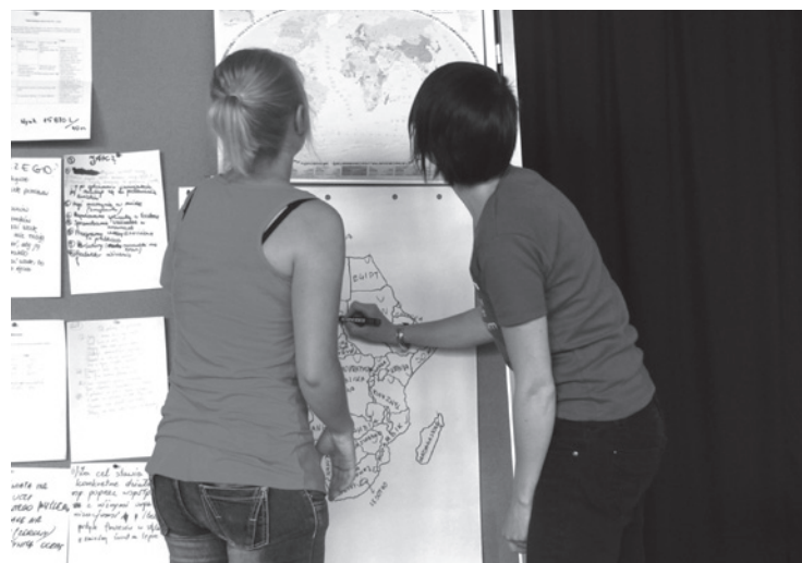
Spotkanie podsumowujące dla Szkół Humanitarnych, Bydgoszcz

Nie wystarczy odpowiedź, że taki jest wymóg ministerstwa odpowiedzialnego za sprawy edukacji w naszym kraju lub słowo „musimy”. Jeżeli chcemy zmotywować uczniów do działania, ukształtować ich nawyki związane z podejmo-