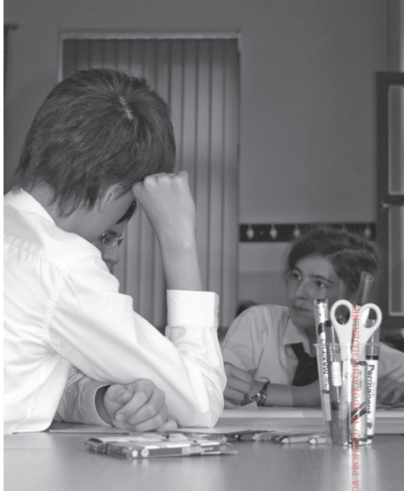
Spotkanie podsumowujące dla Szkół Humanitarnych, Kraków, fot.: Katarzyna Mertuszka/PAH

Projekt edukacyjny jest samodzielną aktywnością ucznia, czy grupy uczniów i nauczyciel powinien przede wszystkim przestrzegać tej zasady. Jego zaangażowanie w tej fazie projektu to przede wszystkim monitorowanie pracy podopiecznych, utrzymywanie z nimi stałego kontaktu podczas zespołowych lub indywidualnych konsultacji, które również mogą być prowadzone z wykorzystaniem narzę-